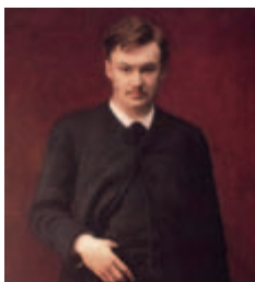
Alexander Glasunow, 1887 Maler: Ilya Repin