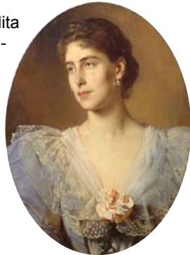
Victoria Melita, 1896.

Das Leben der Prinzessin Victoria Melita von Sachsen-Coburg und Gotha (1876-1936), genannt Ducky, einer Enkelin der britischen Königin Victoria und des russischen Zaren Alexander II, war voll Verwirrungen und Überraschungen. Durch ihre Ehen – beide Male mit ihren Cousins - trug sie die Titel einer Großherzogin von Hessen und unter dem Namen Victoria Fjodorowna den einer Großfürstin von Russland. Die Ehe mit Ernst Ludwig, Großherzog von Hessen, war unglücklich und wurde geschieden. Später heiratete sie den Großfürsten Kyrill Wladimirowitsch, der sich 1924 in Paris zum russischen Kaiser im Exil ernannte. Damit wurde Viktoria Melita zur russischen Kaiserin.